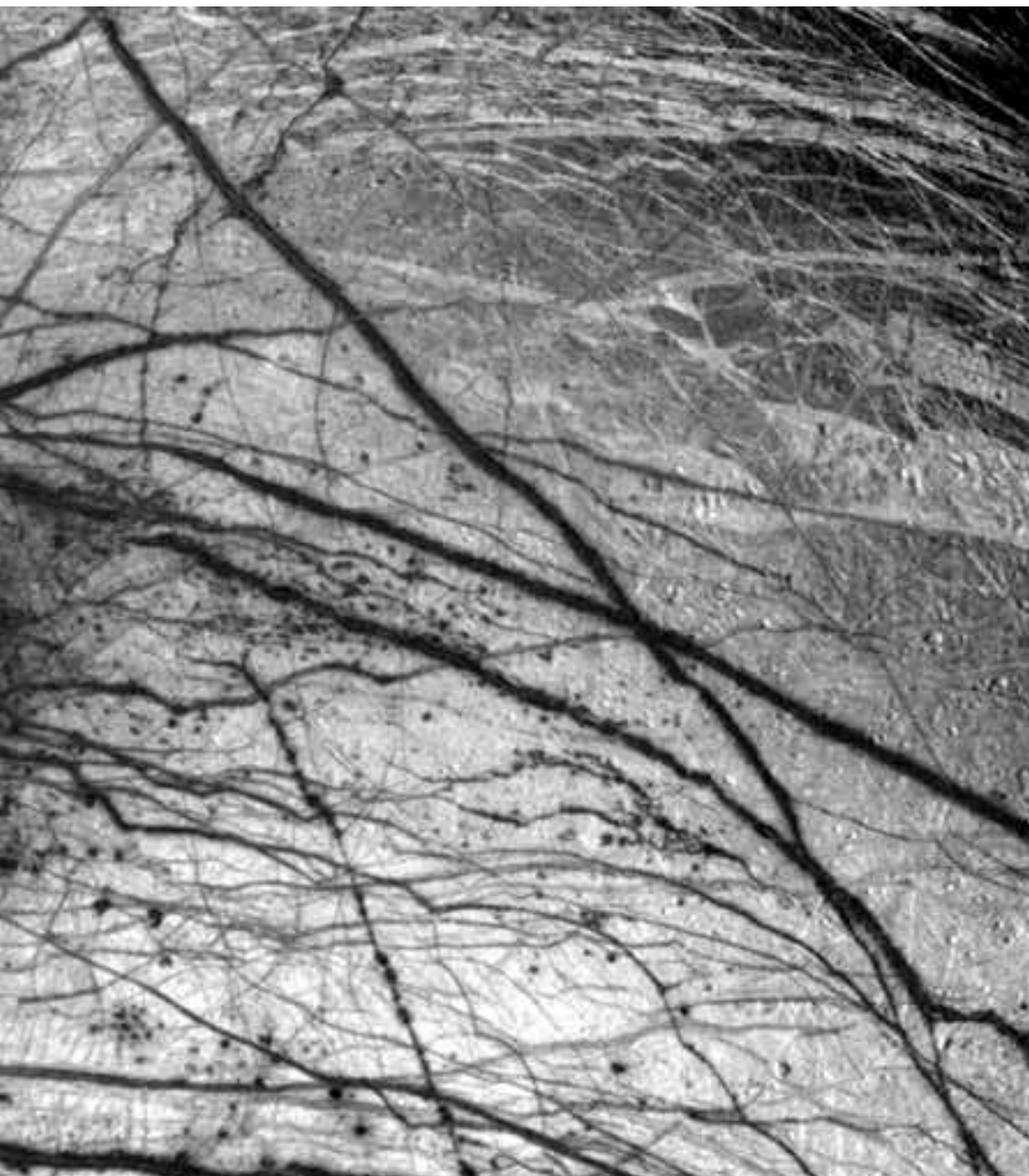
Europe, satellite de Jupiter, sonde Galilée.