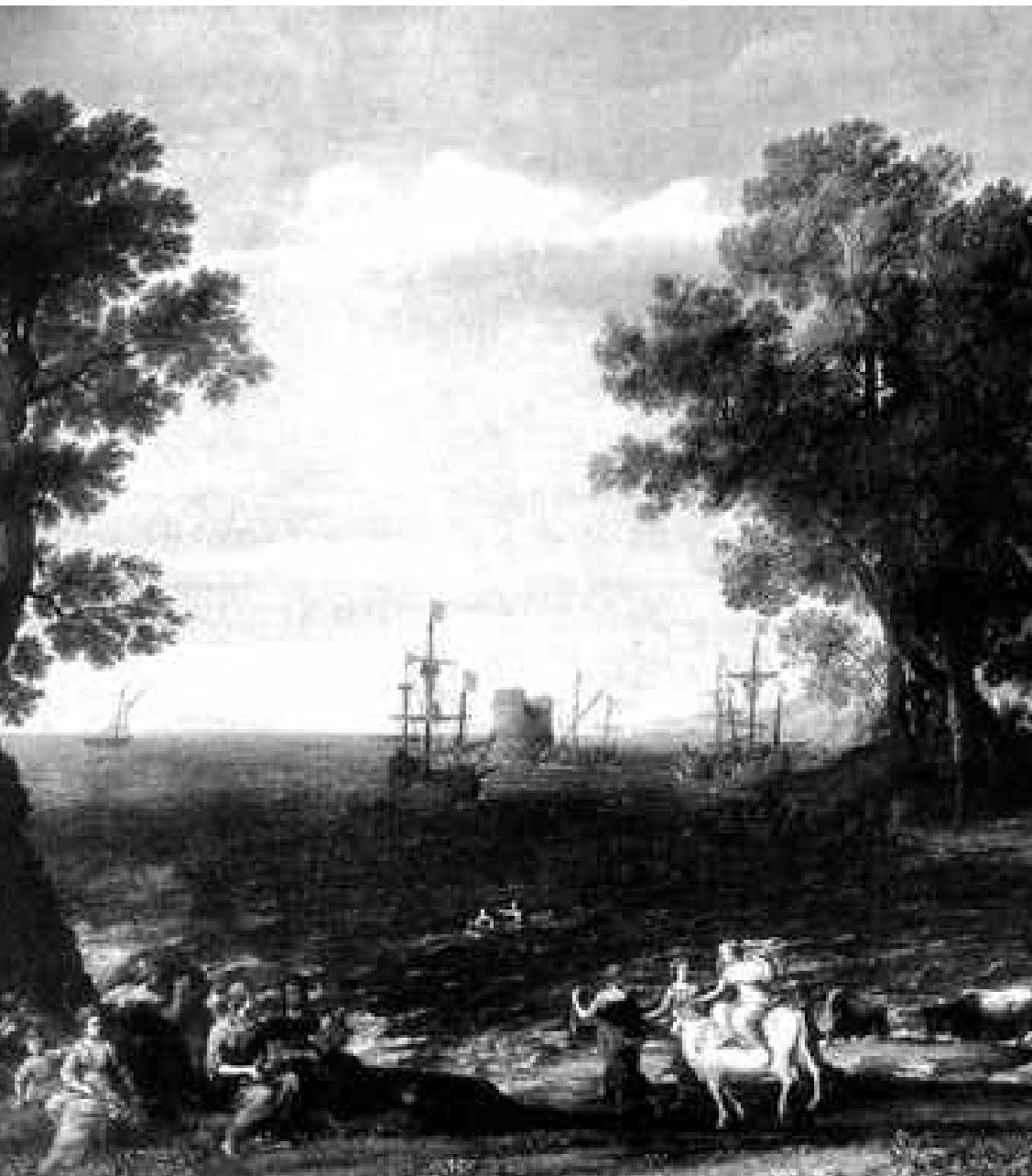
Claude Lorraine (1600-1682), L'Enlèvement d'Europe , Pushkin Museum, Moscou.