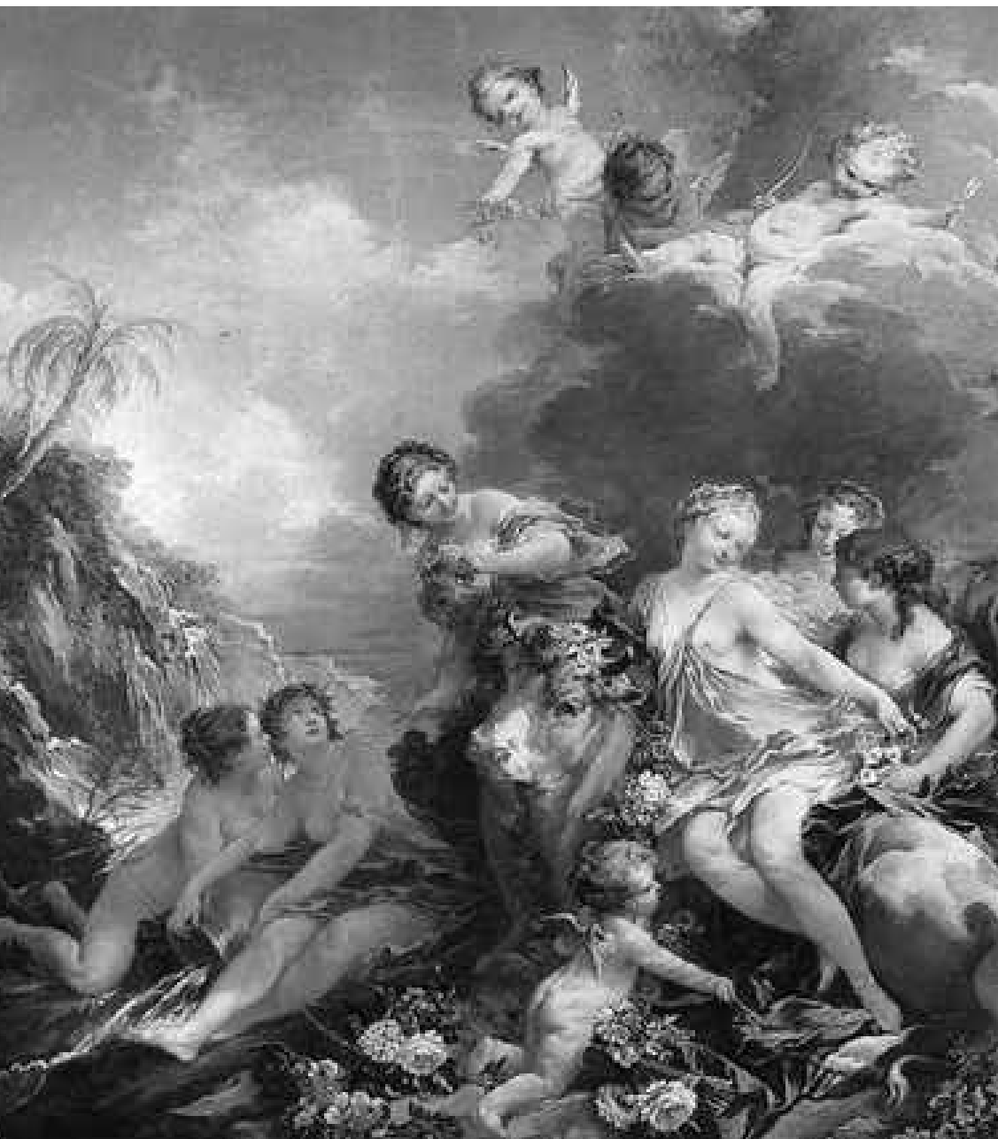
Boucher François (1703-1770), L'Enlèvement d'Europe , Wallace Collection, Londres.