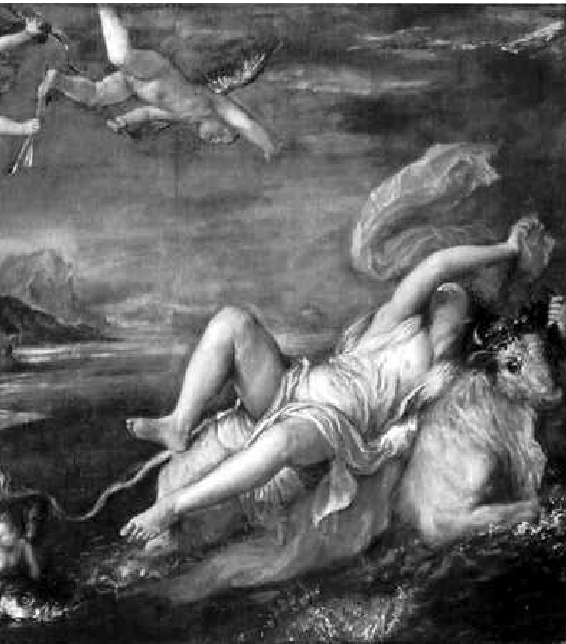
Tiziano Vecellio (1490-1576), L'Enlèvement d'Europe , Garden Museum, Boston.