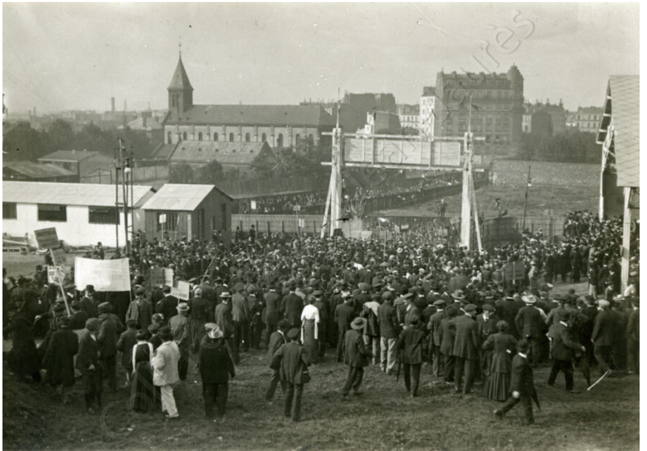
Vue en hauteur de l'Aéro-Park, qui permet de voir l'arrivée progressive des manifestants.