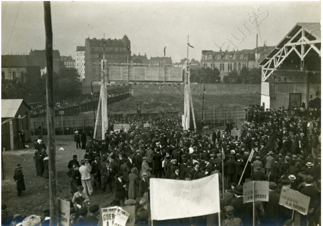
Un hangar est présent dans le parc disposant d'une buvette.

Des endroits sont prévus pour que des militants fassent des discours. On dispose ainsi de trois scènes improvisées où les orateurs s'expriment sur des chaises. À côté de ces tribunes prévues, d'autres prises de parole improvisées ont lieu. Les organisateurs ont pris soin que la parole soit distribuée équitablement entre syndicalistes et socialistes.