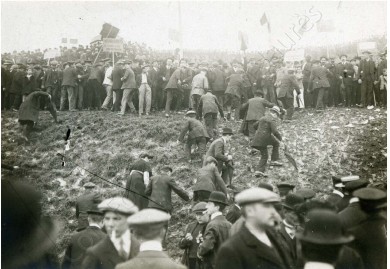
La pluie a rendu le terrain glissant, ce qui rend difficile la montée vers la butte.

succès sont également mentionnées, comme l'inconfort du lieu, où plusieurs endroits sont escarpés et devenus boueux à cause de la pluie, ainsi que le montrent d'autres photographies.