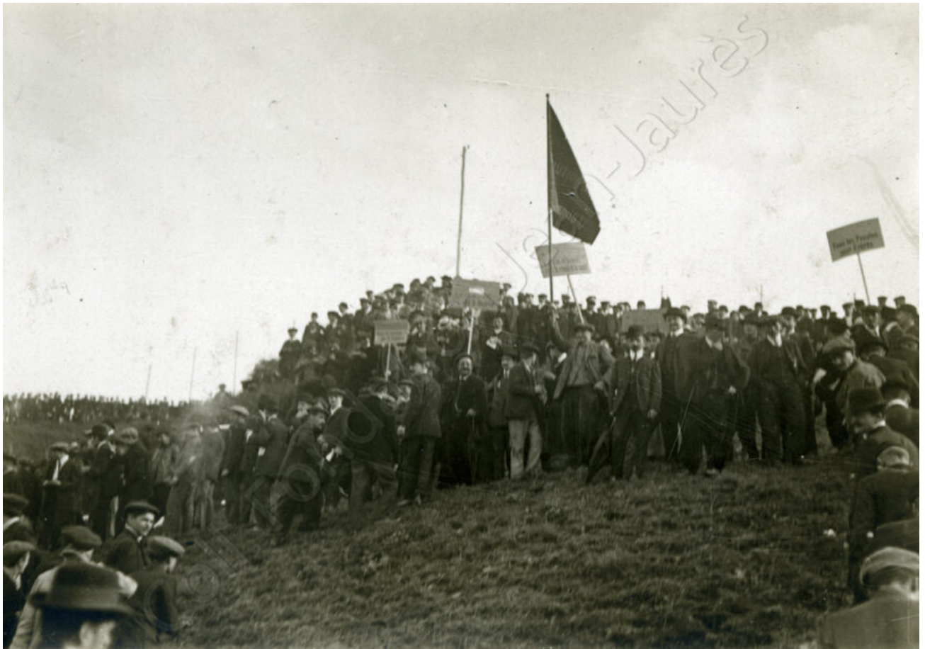
La fédération révolutionnaire communiste est présente avec un drapeau permettant à ses militants de se regrouper.

fédération révolutionnaire communiste, qui regroupe les partisans de l'anarchisme. Fondée en 1910, elle prend le nom de fédération communiste anarchiste quelques mois plus tard. Elle rassemble de nombreux syndicalistes révolutionnaires et des partisans de l'action révolutionnaire et est surtout active à Paris et dans sa banlieue 19 . La présence de ses militants illustre la volonté d'unité lors de ce rassemblement, même si on peut voir sur la photographie que ce groupe se tient quelque peu à l'écart des autres groupes de manifestants.