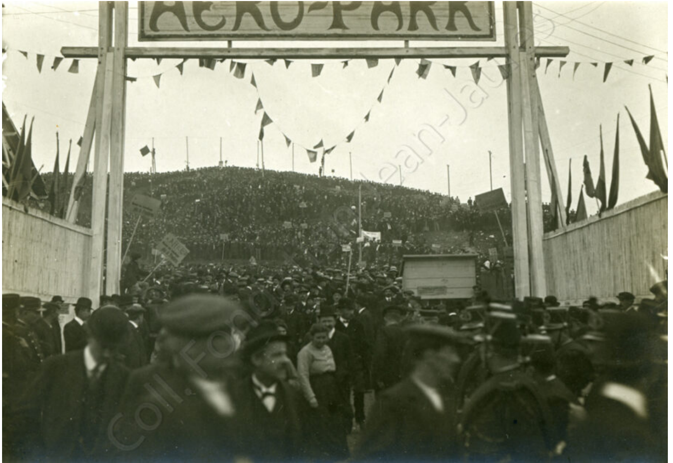
Sortie du meeting contrôlée par les forces de police de chaque côté.