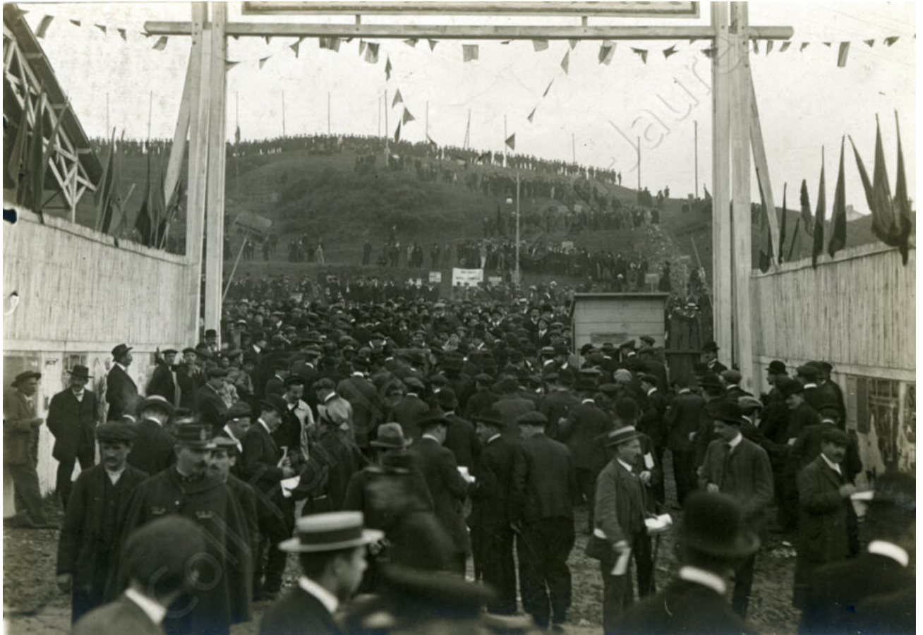
L'ouverture de l'Aéro-Park a lieu à 14h30 le 24 septembre. Situé près des Buttes-Chaumont, le lieu se remplit progressivement de manifestants contrôlés à l'entrée par les forces de l'ordre. On peut également voir la distribution de journaux.

L'ouverture de l'Aéro-Park pour le rassemblement a lieu au début de l'après-midi. L'arrivée des manifestants se fait progressivement et dans le calme et l'entrée est surveillée par les forces de police pour éviter que les militants agissent en dehors de l'enceinte. La presse mentionne le contrôle des pancartes et drapeaux aux abords du lieu. Comme l'explique Marcel Sembat dans L'Humanité du 24 septembre, le jour même de la manifestation : « C'est une manifestation commune, où les socialistes se joindront aux syndicalistes qui l'ont organisée, où des orateurs du parti parleront côte à côte avec des orateurs de la confédération générale du travail que les travailleurs parisiens clameront leur ferme volonté de préserver la paix internationale par tous les moyens en leur pouvoir. »