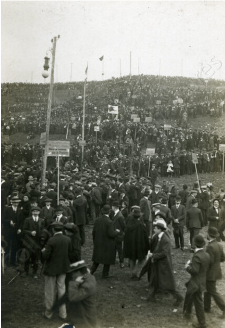
Progressivement, les colonnes de manifestants se remplissent de monde.

Combien y a-t-il de personnes ? La presse militante affirme qu'il y a dans l'après-midi plus de 50 000 personnes : ainsi, le journal La Guerre sociale de Gustave Hervé précise : « Cette réunion en plein air de 60 000 syndicalistes, socialistes ou anarchistes parisiens était si imposante, si impressionnante » tout en indiquant que la pluie a sans doute découragé de nombreuses personnes 11 . Les rapports de police, quant à eux, mentionnent 18 000 manifestants 12 , après avoir craint une foule considérable dans les jours précédents le meeting 13 . Si les organisateurs espéraient davantage de monde, L'Humanité du lendemain affirme que c'est « un succès presque inespéré avec cette sale pluie qui avait l'air de tomber exprès sur commande de Caillaux [président du conseil à cette période] pour noyer l'enthousiasme 14 . » D'autres raisons pour expliquer ce demi-