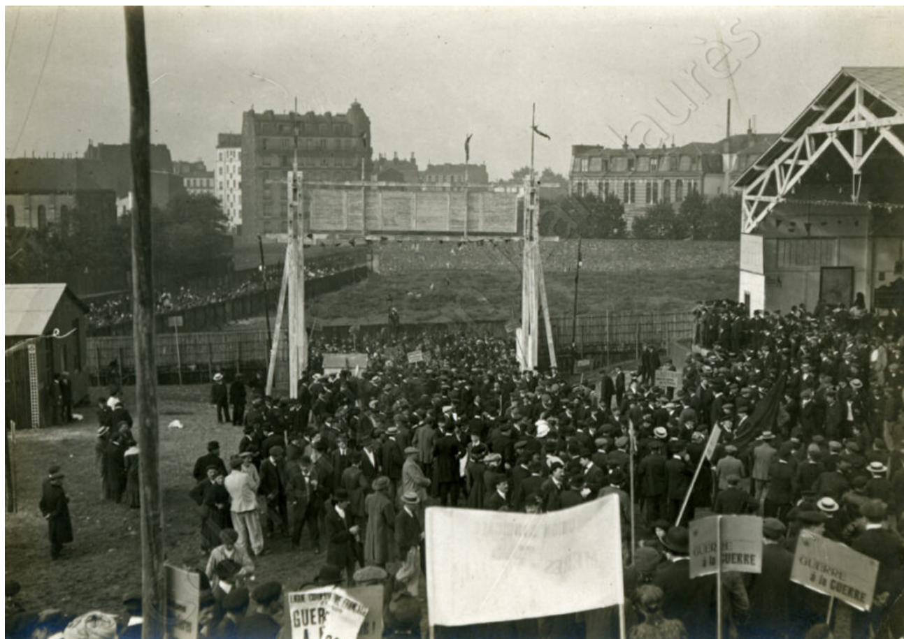
Les pancartes les plus présentes indiquent « Guerre à la guerre ».