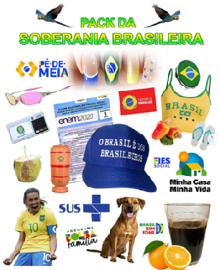
Sélection et montage : Anderson Pinho.

Les semaines suivantes confirment ce changement de registre, cette fois dans un domaine où la communication gouvernementale échoue traditionnellement à produire de l'adhésion : la fiscalité. En septembre 2025, l'annonce de l'exonération de l'impôt sur le revenu des Brésiliens les plus précaires donne lieu à une production intensive de contenus, vingt-neuf publications en un mois, presque une par jour. Le gouvernement déploie un véritable arsenal visuel pour séduire : visuels faits de références à l'imaginaire télévisuel, chats et capybaras personnifiant les contribuables, vidéos générées par intelligence artificielle, etc. L'objectif est explicite : générer des micro-événements numériques capables de circuler largement au-delà du public politisé. Et les chiffres témoignent de l'efficacité de cette mutation : 135 millions de personnes atteintes en six mois, des interactions en hausse de 3000%. Et in fine , une réforme votée à l'unanimité 26 .