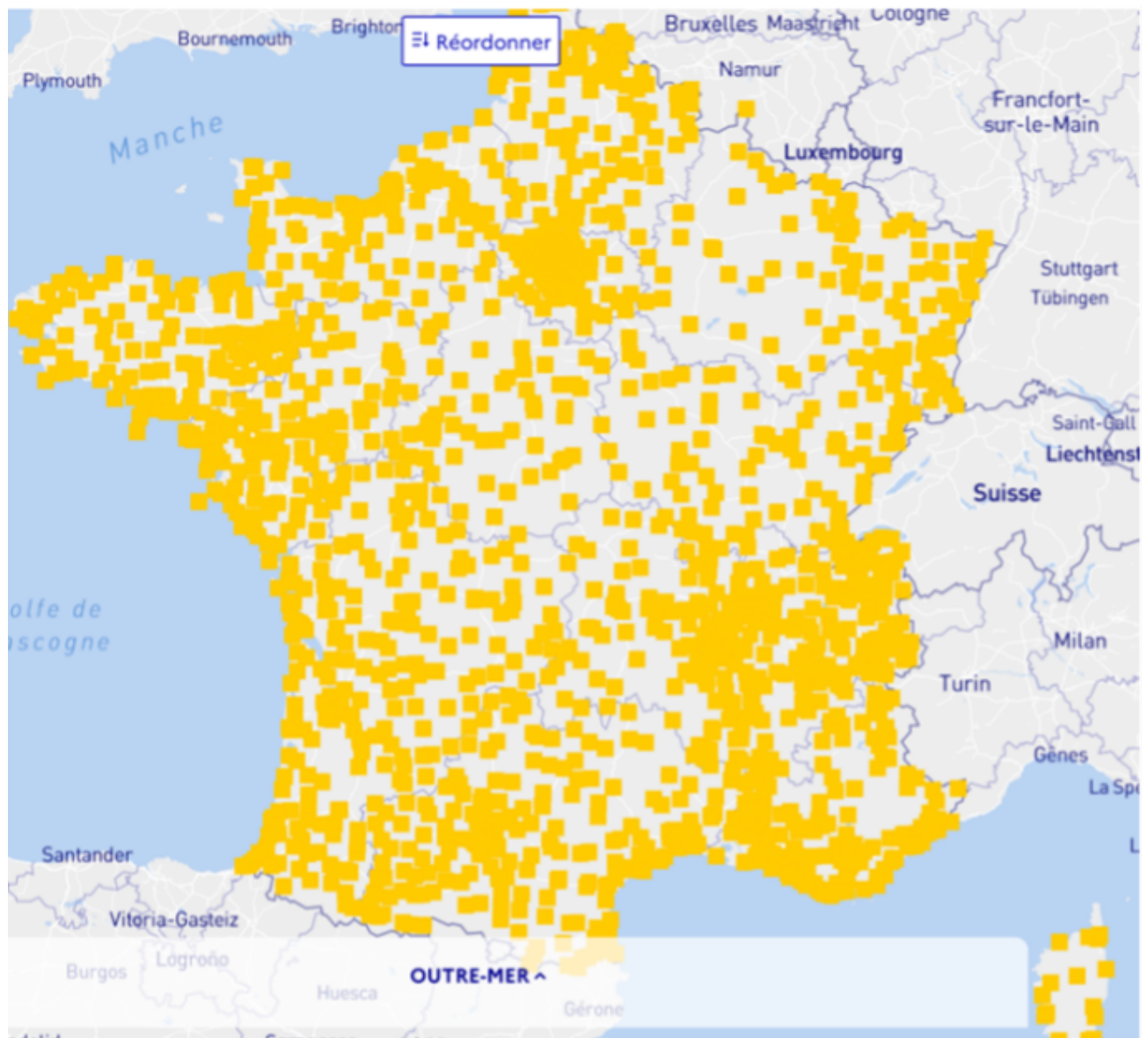
Bibliothèques et points de lecture