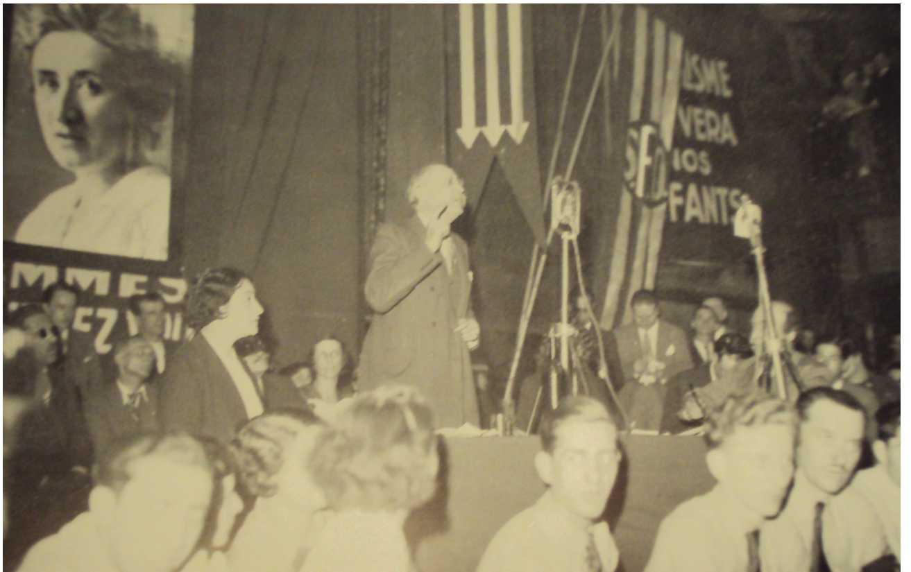
Léon Blum s'exprimant à un rassemblement de femmes socialistes.