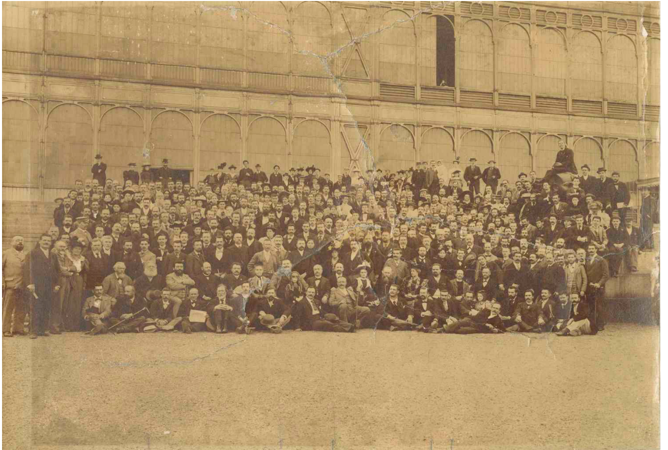
Photographie d'une partie des congressistes de 1896.