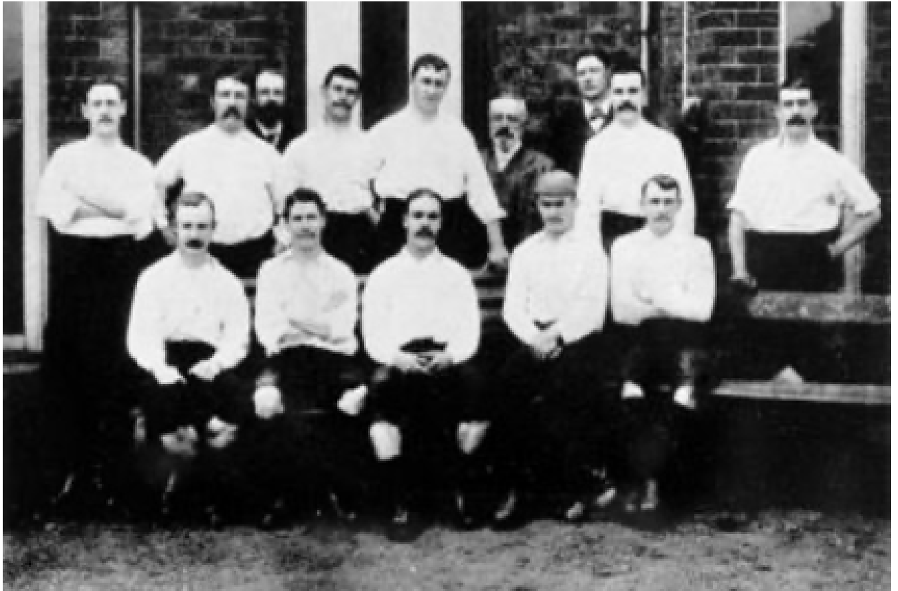
L'équipe de Preston North End Football Team in 1888, auteur inconnu (Source : Wikipedia)

Ces dispositions permettent aux spectateurs – et en particulier aux travailleurs et aux travailleuses, aux employés et employées de maison, libérés provisoirement de leurs labours – de se rendre au stade, d'éviter de longs trajets et d'assister à plusieurs rencontres entre clubs voisins. Le Boxing Day est une journée où l'on prend l'air, après avoir trop bu de Mulled wine et trop mangé de Christmas pudding la veille. Les dirigeants du football réussissent à en faire une journée où l'on a coutume de se rassembler, une journée où l'on prend l'habitude de se retrouver au stade.