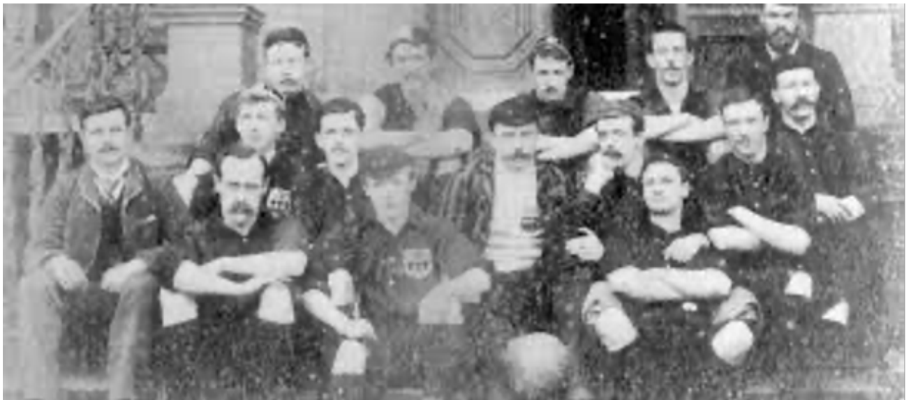
L'équipe de Sheffield FC en 1860, auteur inconnu