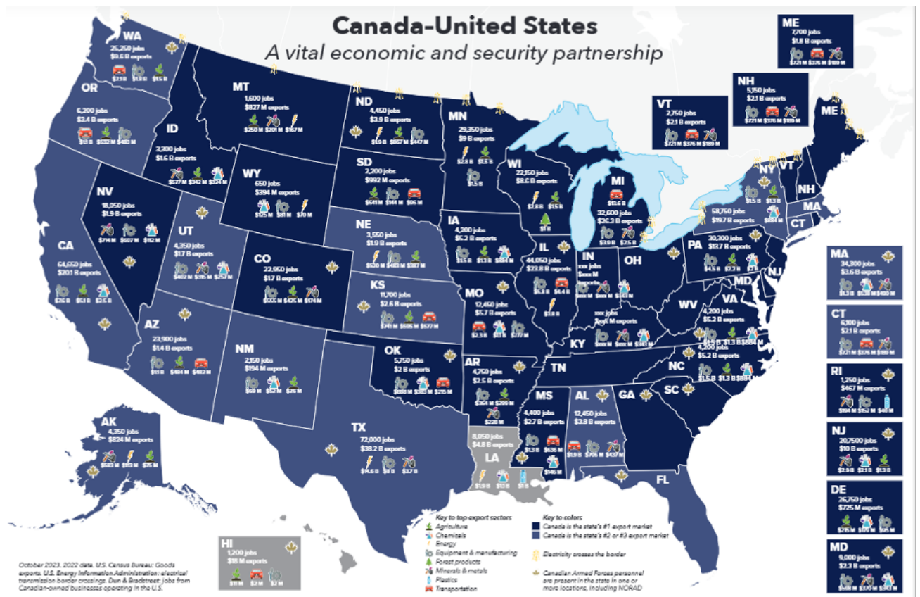
Figure 4. La dépendance économique des États-Unis envers le Canada

Pour le moment, Trump aura réussi la gageure d'« unifier les Canadiens » ainsi que la classe politique canadienne, pour reprendre les mots de l'ancien Premier ministre libéral Jean Chrétien (1993-2003) qui a publié, le 11 janvier 2024, une lettre ouverte dans La Presse , exhortant les décideurs – ou futurs décideurs – politiques à passer à l'offensive, en faisant preuve de