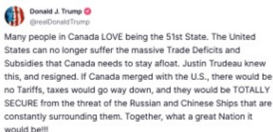
Figure 1. Post de Donald Trump sur son réseau social Truth Social (2025)

Évidemment, au vu de la taille du pays, des disparités régionales existent et traditionnellement, les provinces maritimes (Nouvelle-Écosse, Nouveau-Brunswick et Île-du-Prince-Édouard) ainsi que la