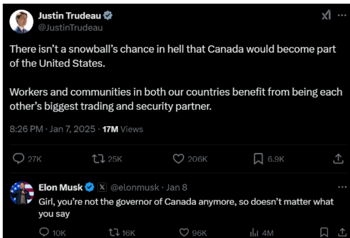
Figure 3. Réponse de Justin Trudeau sur X à la suite des déclarations de Trump sur l'annexion possible du Canada et commentaire de Elon Musk