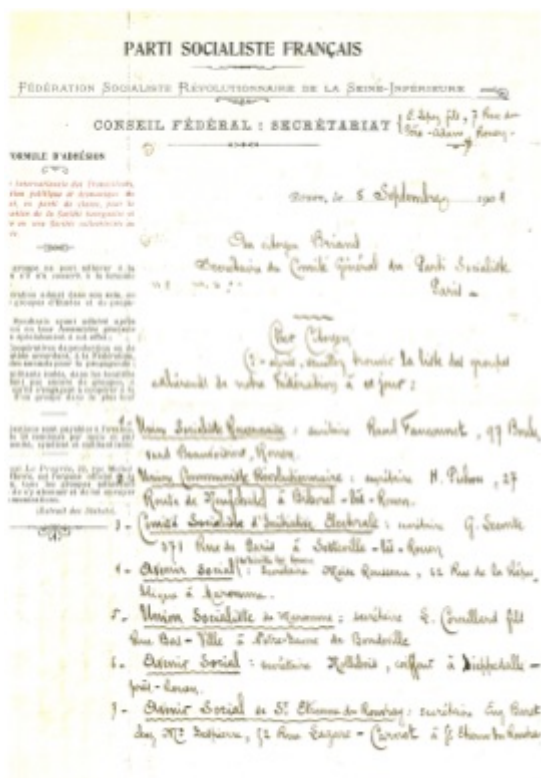
Extrait des groupes adhérents à la Fédération Socialiste Révolutionnaire de Seine-Inférieure adressé à Briand

rédaction, des séances de la commission Armée de la Chambre des députés entre 1914 et 1919 ou pendant des réunions internationales dès 1918 puis de l'Internationale ouvrière socialiste après 1923. L'inventaire définitif affinera ces trop brèves remarques.