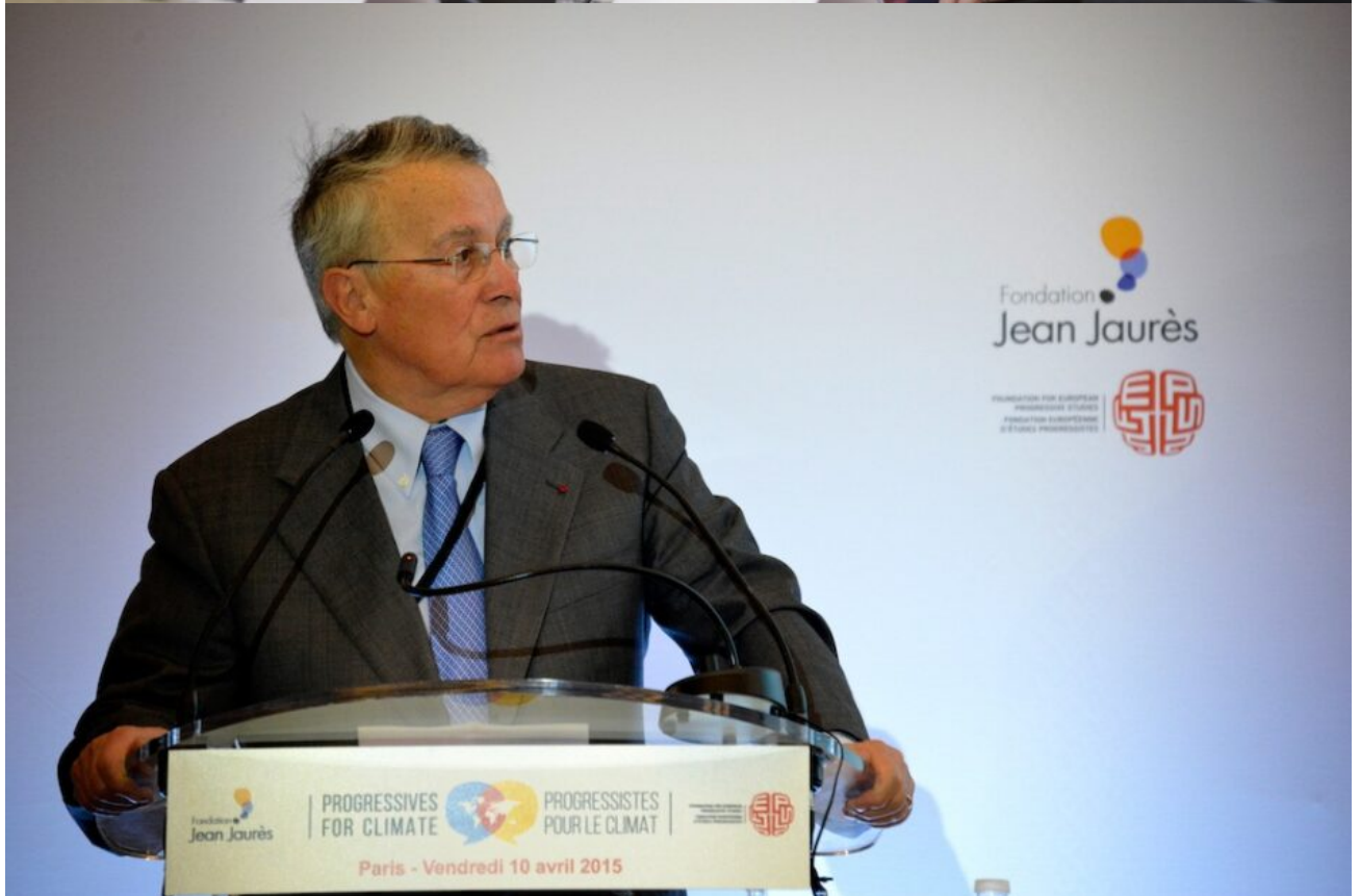
La conférence « Progressistes pour le climat » réunissait à Paris, à quelques mois de la COP21, un large panel de personnalités politiques et scientifiques pour discuter des solutions nationales et