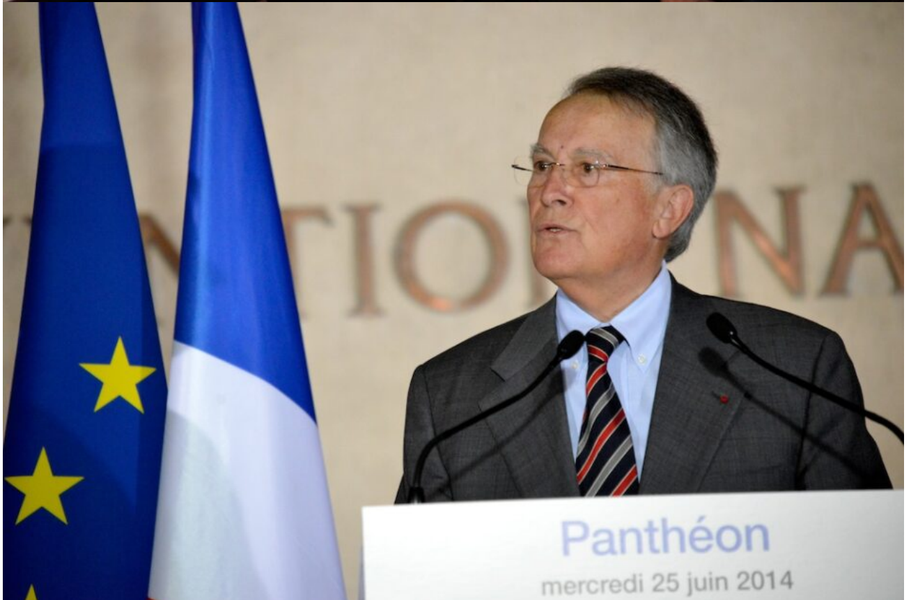
Inauguration par Monsieur Le Premier ministre de l'exposition « Jaurès contemporain 1914-2014 », mercredi 25 juin 2014.