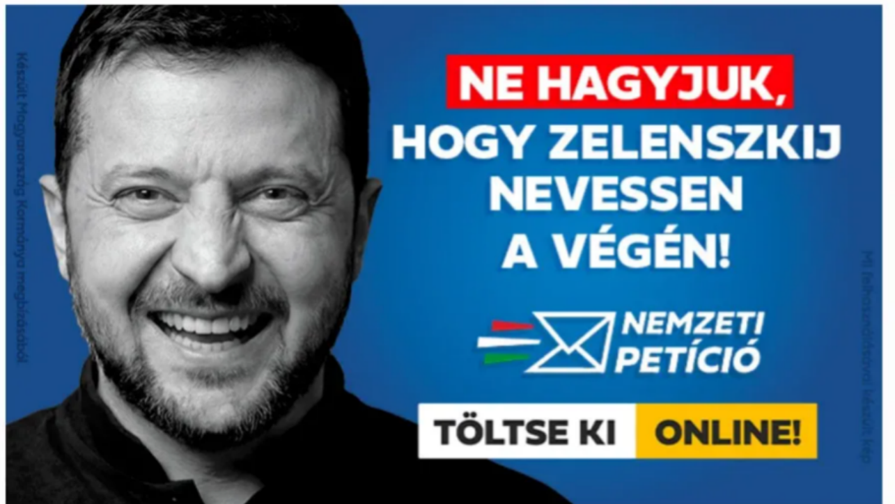
Társadalmi célú hirdetés