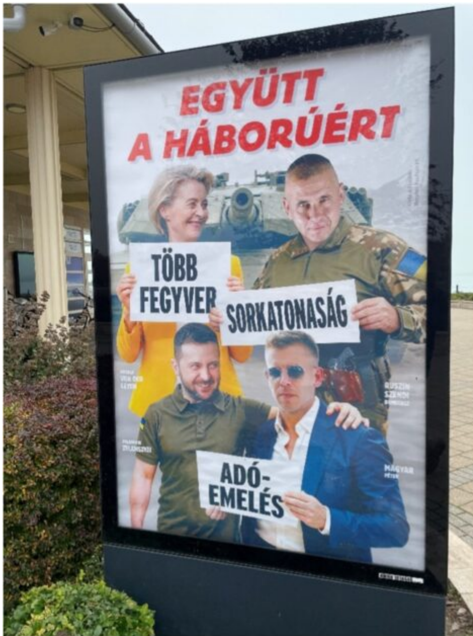
Photographie : Matthieu Boisdron (novembre 2025).

Zelensky: « Ne laissons pas Zelensky avoir le dernier mot (rire le dernier) »