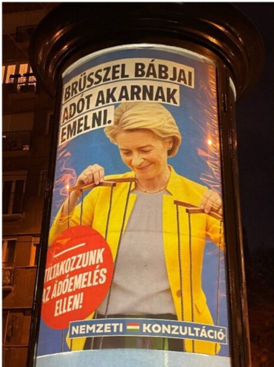
Photographie : Matthieu Boisdron (novembre 2025).

« Bruxelles veut financer la guerre avec vos impôts. Protestons contre l'augmentation des impôts »