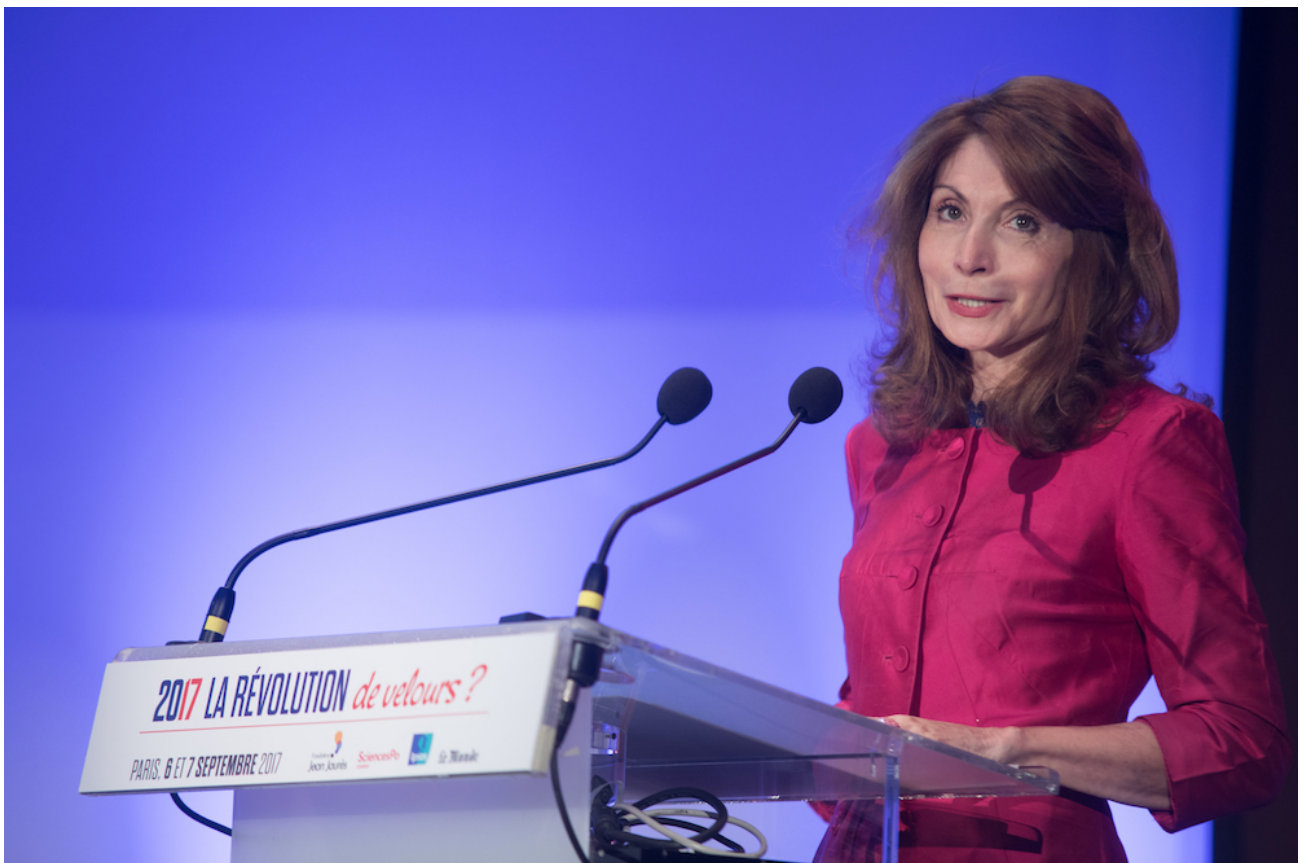
Monique Canto-Sperber