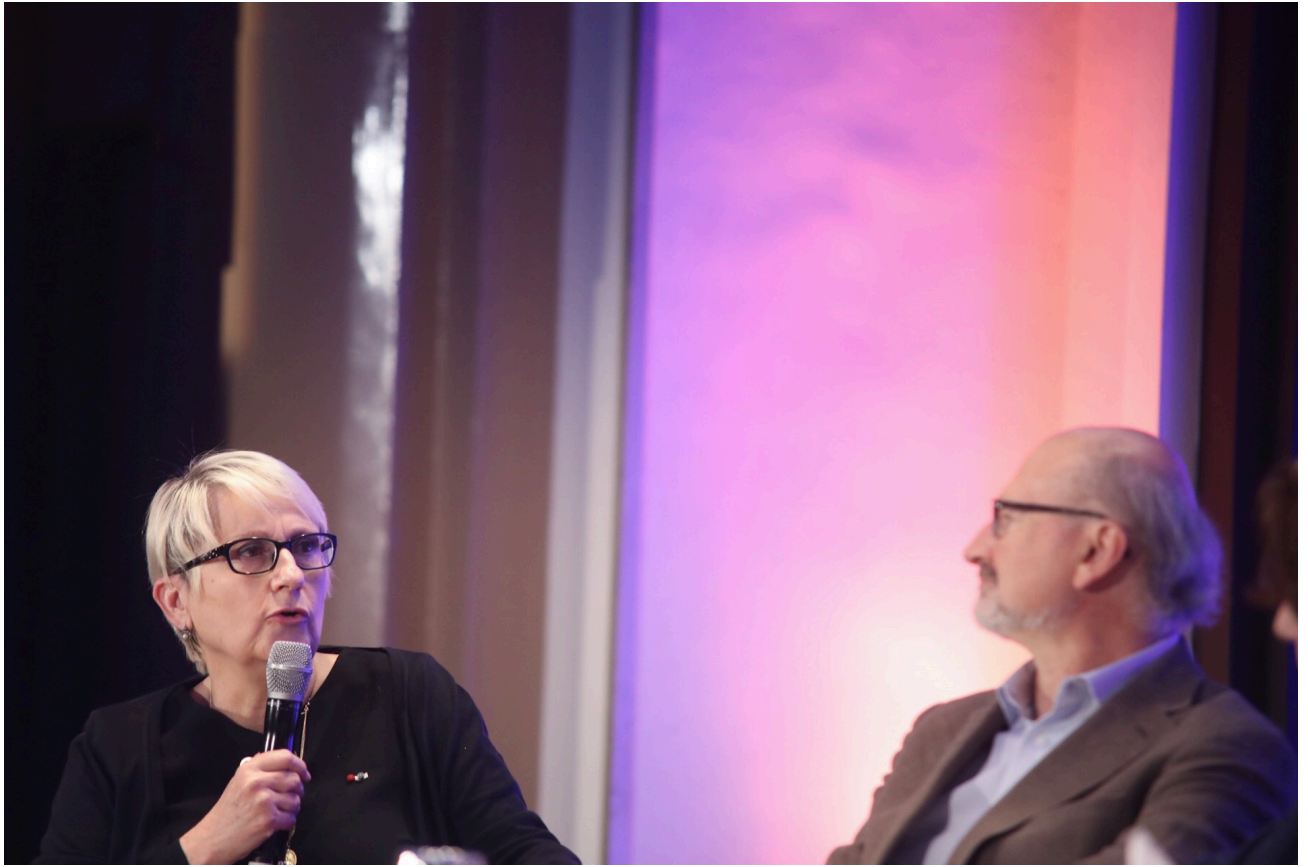
Mercedes Erra, Éric Fottorino