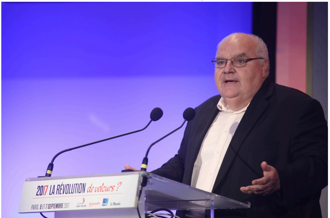
Crédits: Fondation Jean-Jaurès / Mathieu Delmestre : Alain Bergounioux