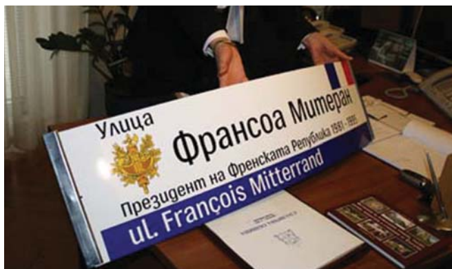
Inauguration de la place François Mitterrand à Plovdiv (Bulgarie) le 19 janvier 2009

En partenariat avec la FJJ et l'Institut François Mitterrand, l'Institut culturel français de Sofia a commémoré le vingtième anniversaire de la visite du président Mitterrand en Bulgarie, les 18 et 19 janvier 1989. Cet événement s'est décliné autour de plusieurs temps forts. Le 19 janvier 2009, un colloque, pour lequel six personnalités venues de France s'étaient dépla-